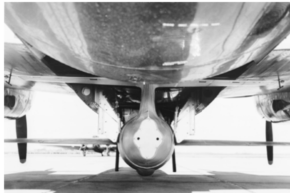
Photo de l'avion supersonique Bell-X1