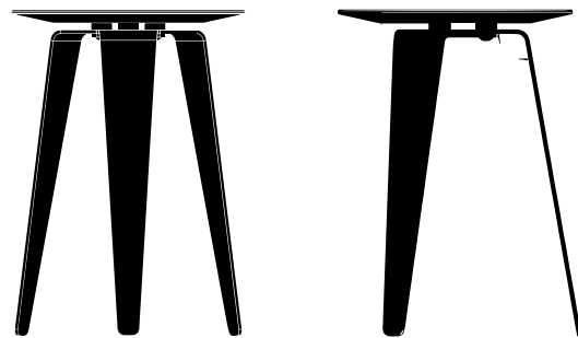
Dessin technique du tabouret Bell X1