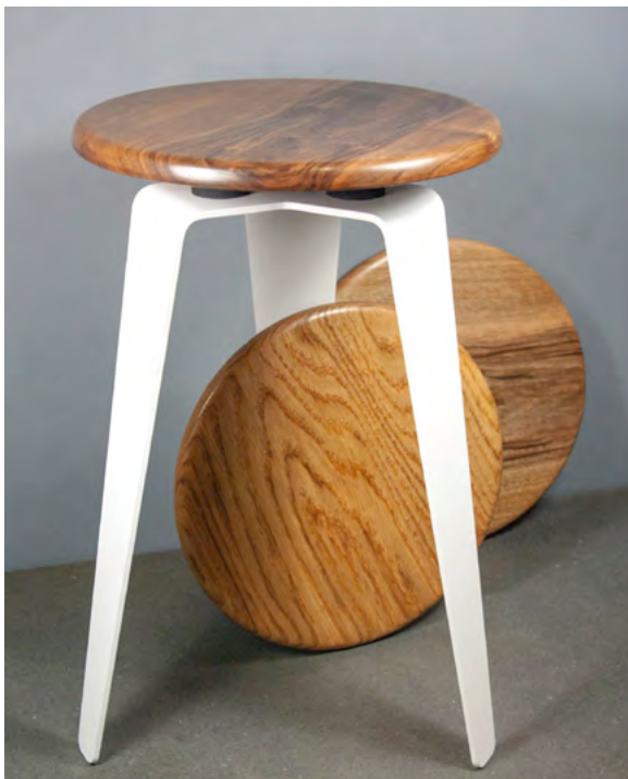
Photo du tabouret Bell X1 édition blanc et chêne.

Vous retrouverez également une promenade photographique où vous pourrez découvrir une sélection de nos projets.